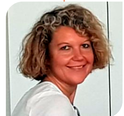
ROSSELLA MARZOLLA ADMINISTRATION OFFICE